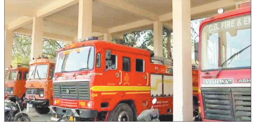
कार्यालय में खड़े दमकल वाहन।

नगर निगम क्षेत्र में कहीं भी आगजनी की घटना होने पर आग बुझाने के लिए दमकल विभाग की टीम को बुलाया जाता है। दमकल की टीम भी अपने वाहनों के साथ समय रहते मौके पर पहुंचती है और आग बुझाने का काम करती है लेकिन पिछली कुछ आगजनी की घटनाओं के दौरान दमकल विभाग को एक बड़ी चुनौती का सामना करना