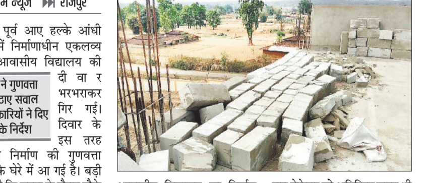
आवासीय विद्यालय का निर्माण किया जा रहा है। इस परियोजना का वचुअल शिलान्यास किया गया था और निर्माण कार्य की जिम्मेदारी केंद्र सरकार की एजेंसी को सौंपी गई है, जबकि इसकी मॉनिटरिंग राज्य स्तर से की जा रही है। निर्धारित समय सीमा में भवन निर्माण पूर्ण किया जाना था, लेकिन समय सीमा बीतने के बावजूद कार्य अधूरा है। विभाग

गिरने से निर्माण की गुणवत्ता सवाल के घेरे में आ गई है। बड़ी बात यह है कि घटना के दौरान मौके पर कोई मजदूर मौजूद नहीं था जिससे एक बड़ा हादसा टल गया। वहीं घटना के बाद निर्माण की गुणवत्ता के साथ ही छात्रों की सुरक्षा को लेकर ग्रामीणों ने चिंता जाहिर की है।