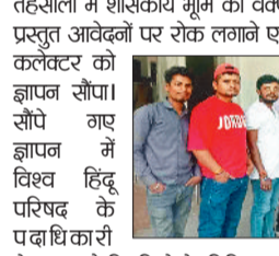
सौंपा गए ज्ञापन में विश्व हिंदू परिषद के पदाधिकारी

अंबिकापुर। विश्व हिंदू परिषद के पदाधिकारी व सदस्यों ने जिले के विभिन्न तहसीलों में शासकीय भूमि को वक्फ संपत्ति के रूप में दर्ज, नामांतरण करने हेतु प्रस्तुत आवेदनों पर रोक लगाने एवं उच्च स्तरीय जांच कराने की मांग को लेकर कलेक्टर को ज्ञापन सौंपा।